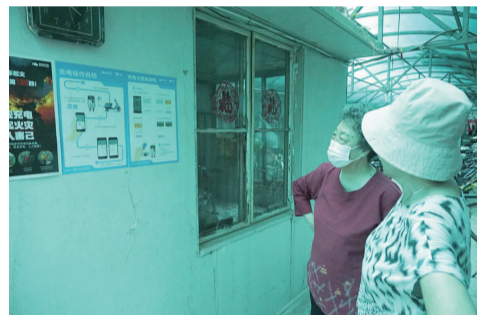
居民阅读充电桩使用方法

会使用扫码充电,因此我们选用刷卡及扫码两用式的充电设备,方便老年人使用。”社区工作人员说道。目前在自行车棚北侧完成一台充电设备安装,并配有12个充电孔,可以满足两孔及三孔插座的不同需要。充电费用为每三小时一元钱,不足三小时的按三小时计算。居民在使用时只需在刷卡机上刷卡启动充电插口,即可使用。