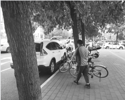
快递小哥摆放共享单车

为进一步加强对外卖员、快递员等新就业群体的政治引领和服务凝聚，双井街道探索“五带五心”工作法，以访带建聚党心、以问带需守初心、以走带办凝民心、以联带融传真心、以惠带和暖人心，共育美好朝阳骑士“驿家人”。