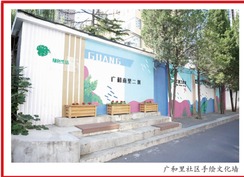
广和里社区手绘文化墙