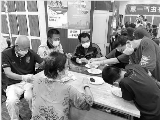
快递小哥与社区居民一起包月饼