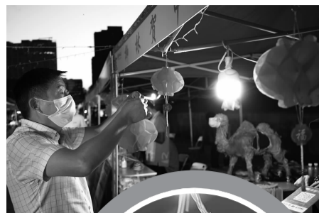
▲集市上商家悬挂灯笼