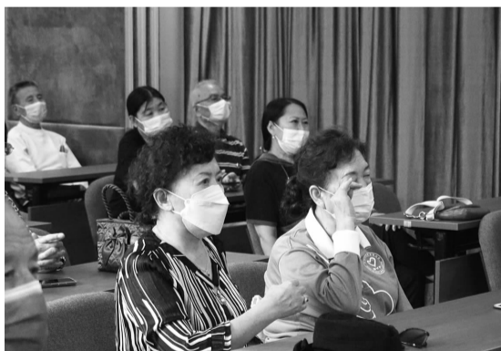
居民代表听到宣讲员故事忍不住落泪

院长大的他非常乐观开朗，国家、孤儿院以及各位爱心人士都给予了很多关爱，让他能够无忧无虑长大，他非常感激能够生活在这样一个温暖的国度。