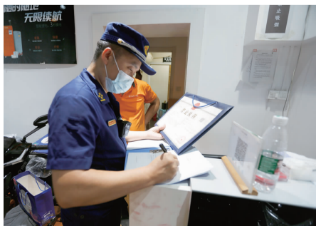
联合夜查检查商户

据工作人员介绍，自9月22日起，将每晚在全区范围内开展集中错时督导检查行动，确保辖区安全。22晚夜查重点对辖区内重点区域如电动车经营场所存在的违规拆改装蓄电池以及“三合一”等问题，电动车“进楼入户”、楼内公共区域停放充电等问题开展检查。此次检查还对辖区内居民和经营场所人员进行消防安全提示，对存在电动自行车及蓄电池违规“进楼入户”、“人车同屋”的户主进行说服教育，认真分析了“飞线”充电存在的火灾安全隐患，要求其将电动自行车及蓄电池转移至安全区域，并以因电动车而引发的火灾事故为例，警示其重视电动车防火工作。