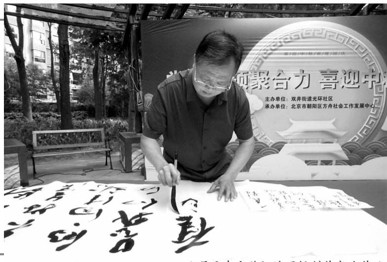
▲居民在文艺汇演现场创作书法作品

“明月几时有，把酒问青天……”又是一年花好月圆夜，在这个月圆人团圆的日子里，您是如何度过的呢？在这美好的时刻，双井街道各社区纷纷组织居民开展包月饼、做灯笼、文艺汇演等多种形式活动，共庆佳节。