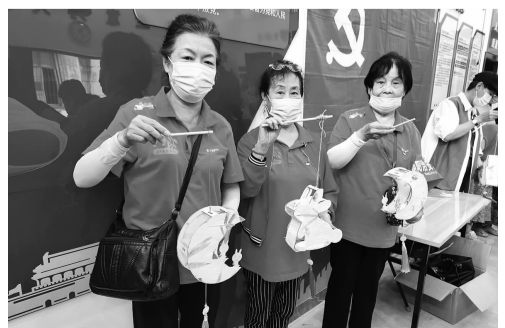
居民展示自己制作的灯笼

据了解，现场制作的月饼除了会分发给在场参与制作的老人外，还将送给辖区的孤寡老人，让他们一起分享到居民制作的美食，并祝愿他们节日快乐。