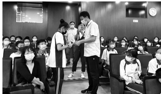
老师现场为同学们讲解邮票故事

正所谓方寸之间看世界，孩子们通过小小的邮票可以学到很多的知识。通过本次“专题讲座进校园”活动，不仅对传播集邮知识，弘扬集邮文化起到了积极的推动作用，而且同学们认识到今日幸福生活的来之不易，纷纷表示一定要不断追寻党的足迹，坚定听党话、跟党走信念，努力学习，成长为国之栋梁。