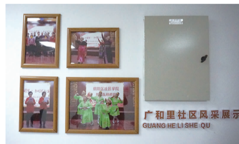
社区活动室照片展示墙

“这个屋子以前也是活动室,但是设施比较陈旧,今年我们对活动室进行了整体装饰,并将居民公约等内容上墙。”社区工作人员说道。走进广和南里二条8号楼居民活动室,就可以看见墙面上张贴了广和里社区居民公约、楼门风采、小区物业管理委员会人员名单等。这里不仅可以作为活动室使用,还是小区的居民议事厅。当小区内居民产生分歧时,可以在这里进行协商解决。“我们还