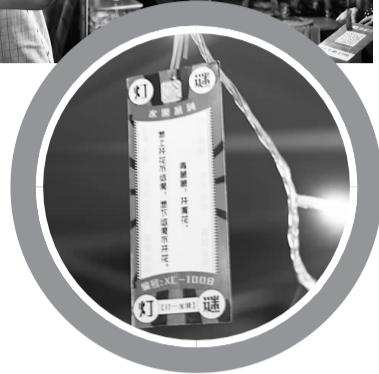
▲中秋集市现场灯笼